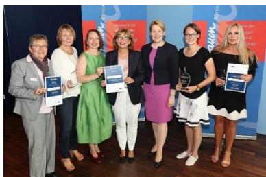
Gruppe der Preisträgerinnen mit Bundesministerin Dr. Franziska Giffey, BMFSFJ