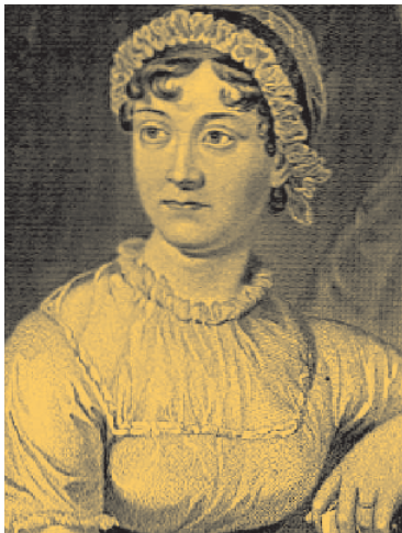
Porträt Jane Austens