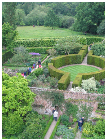
Blick in Sissinghurst Gardens